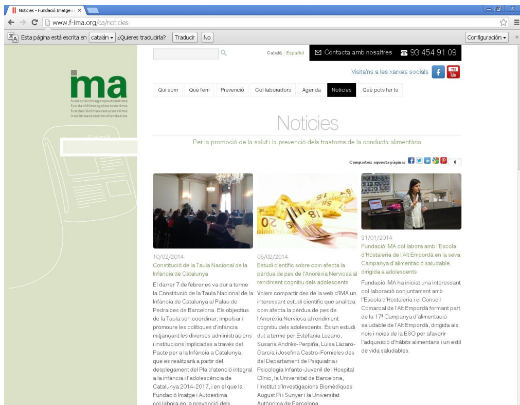
Notícies publicades setmanalment a la web de Fundació IMA

La nova website es caracteritza per la innovació en els continguts i la facilitat per a accedir-hi a través de l'apartat notícies (publicades setmanalment) i a través del seu cercador: