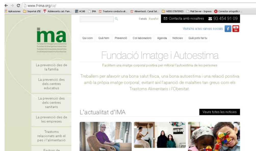
Pàgina principal de la nova web de Fundació IMA

La nova website aporta documentació en format guies, llibres, articles, àudios, working papers, test, qüestionaris i altres publicacions per a famílies, educadors i educadores i empresa per a la prevenció dels trastorns de la conducta alimentària. Aquestes guies ofereixen informació actualitzada sobre els trastorns de la conducta alimentària, pautes per a la seva detecció precoç i les recomanacions per a la seva prevenció. L'accés a aquest material és lliure, gratuït i accessible a qualsevol persona.