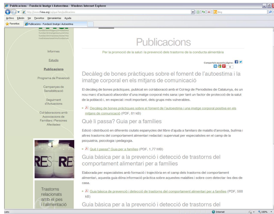
Guies publicades per Fundació IMA accessibles de forma gratuïta a la seva web

Aquestes publicacions aborden diferents aspectes relacionats amb aquestes malalties i les seves causes per comprendre-les millor.